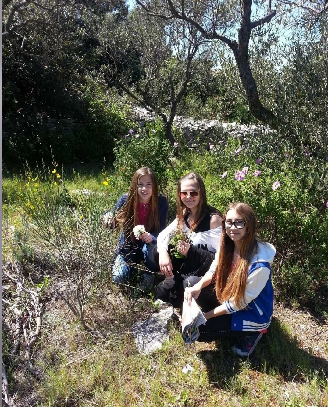
Upotrazi za ljekovitim biljem....